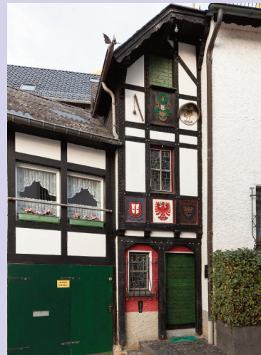
Schmalstes Haus Blankenheims

Einer der romantischsten Winkel Blankenheims ist der Zuckerberg 9 . Neben dem schmalsten Haus Blankenheims - nur 2,01 m breit - sind hier einige der ältesten Fachwerkhäuser Blankenheims zu finden. So ziert den Schwellbalken eines zweigeschossigen am Hang gebauten Fachwerkhäuses eine Inschrift aus dem Jahre 1595.