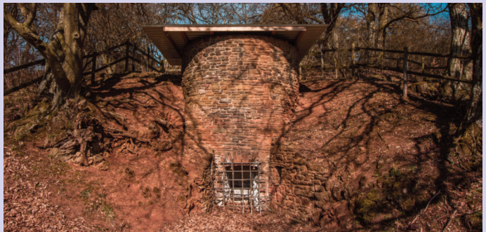
Kalkofen bei Rohr / Lindweiler

Der 1988 restaurierte einzügige Trichteralkofen bei Rohr / Lindweiler wurde um 1850 errichtet. Ein bäuerliches Kalkofenfest im Herbst 1988 demonstrierte unter wissenschaftlicher Begleitung des Geologischen Instituts der RWTH Aachen die Techniken des Kalkbrennens zu Großvaters Zeiten.