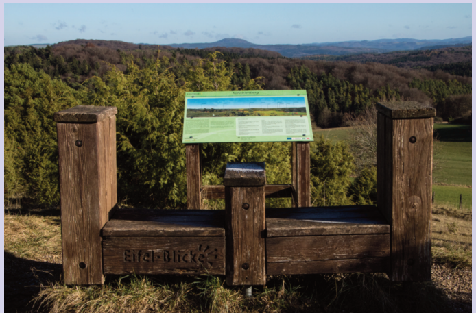
Kalvarienberg bei Alendorf

Der sogenannte Kalvarienberg ist aus zweierlei Gründen während des gesamten Jahres Ausflugsziel für viele Einheimische und Gäste. Auf den Besucher wartet hier eine üppige Wacholdervegetation; für viele Gruppen ist Alendorf Ausgangspunkt in das einmalige Wacholderschutzgebiet Lampertstal. Von der ehemaligen katholischen Pfarrkirche St. Agatha führt ein Kreuzweg zum Schlusskreuz auf den Kalvarienberg. Graf Salentin Ernst von Blankenheim ließ 1663 anstelle des heutigen Schlusskreuzes eine Kapelle errichten, die mittlerweile nicht mehr vorhanden ist. Die von 1663 bis 1680 errichteten Kreuzwegstationen wurden im 19. Jh. auf 14 vermehrt.