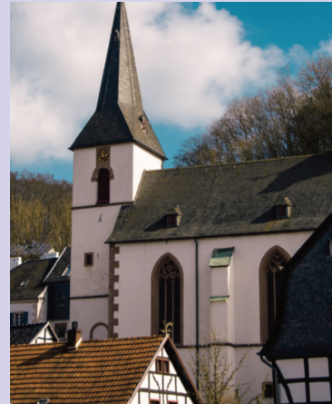
Pfarrkirche St. Mariä Himmelfahrt

Weiter führt der Weg rechts zur Pfarrkirche St. Mariä Himmelfahrt 7 . Die katholische Pfarrkirche Blankenheims ist eine spätgotische Hallenkirche. Graf Johann I. von Manderscheid-Blankenheim ließ sie zwischen 1495 und 1505 errichten. Die Kirche birgt noch heute sakrale Kostbarkeiten, wie den Hochaltar und die beiden Seitenaltäre von etwa 1440, den Strahlenkranz und eine Reliquiensammlung mit der Reliquienbüste des hl. Georg, ganz in Silber von etwa 1440.