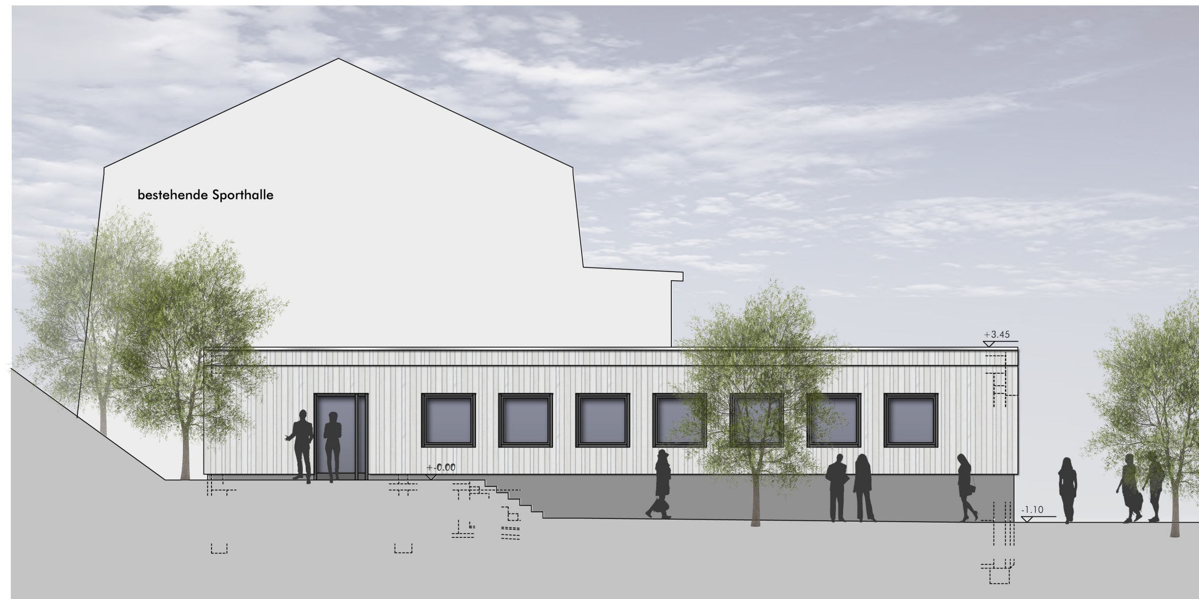
Ansicht Nord-Ost M. 1:100