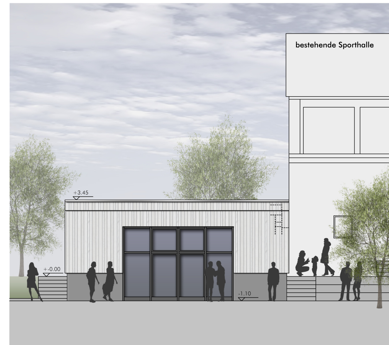
Ansicht Süd-West M. 1:100