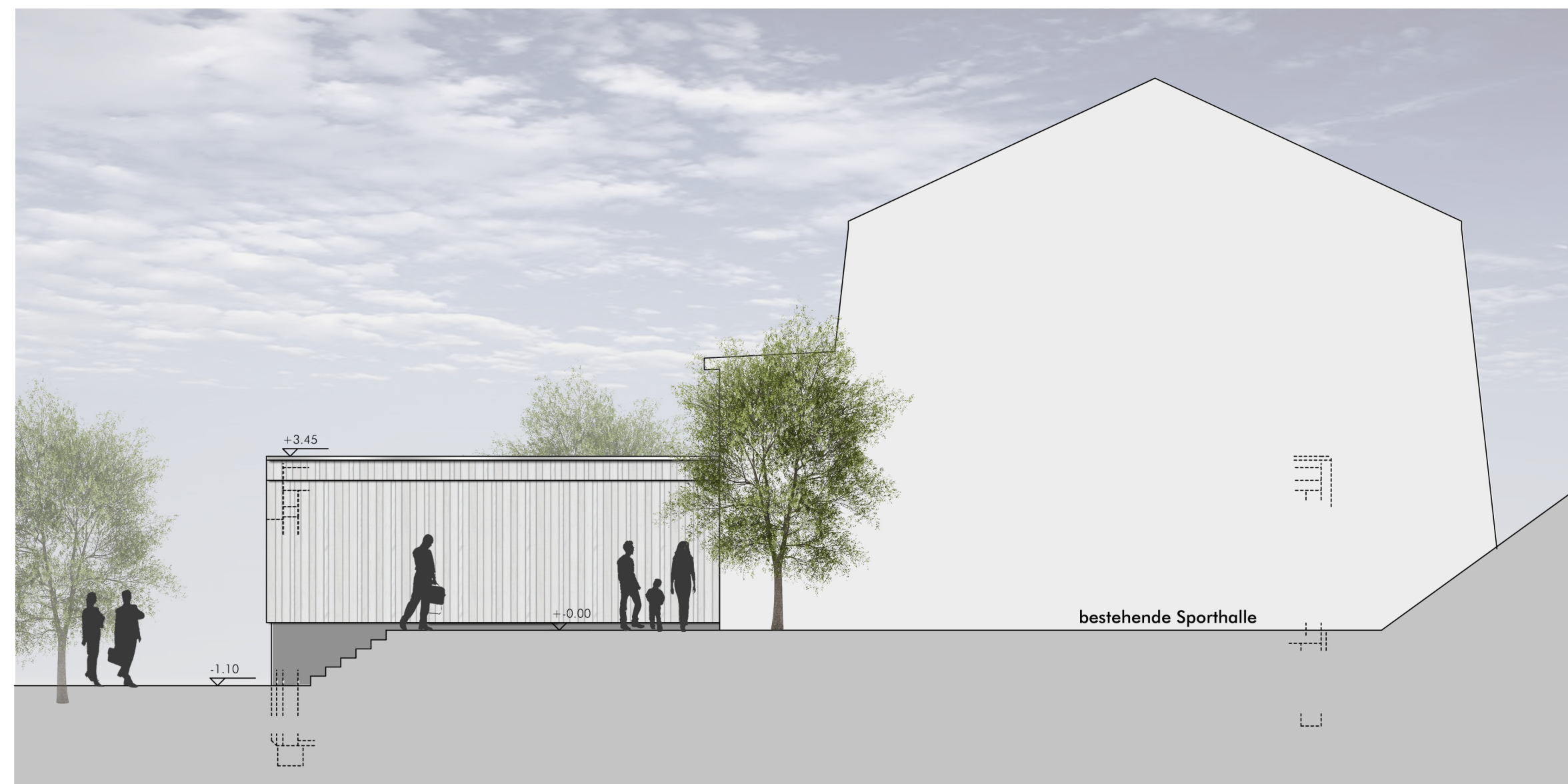
Systemschnitt A-A Haus der Jugend M. 1:100