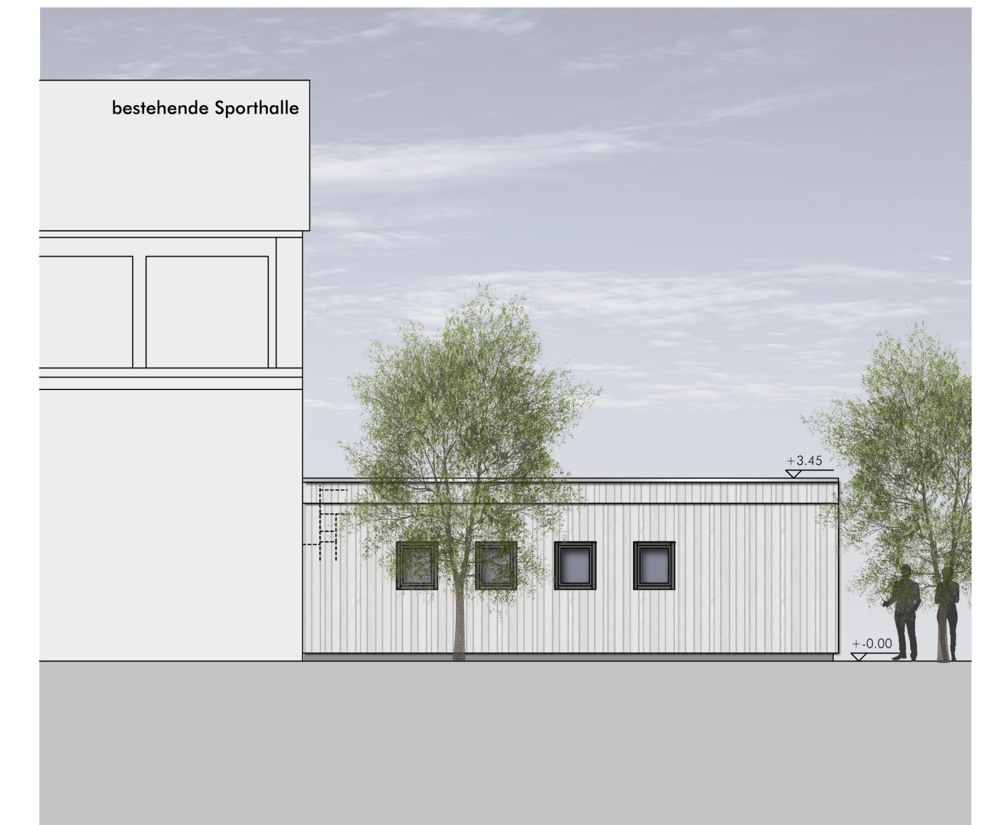
Ansicht Nord-West M. 1:100